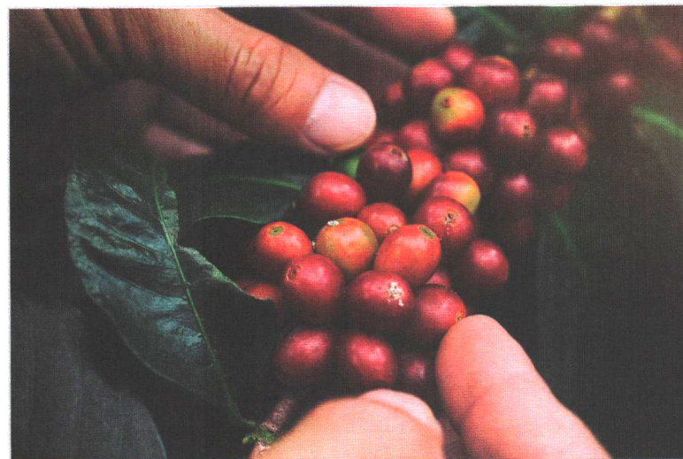
شکل ۱- برای دریافت شیرینی بیشتر از قهوه، چیدن گیلاس‌ها زمانی که به طور کامل رسیده‌اند اهمیت بسیاری دارد.