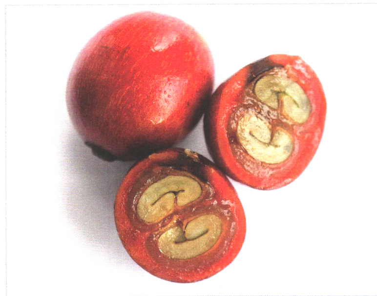
شکل ۲- دانه‌های قهوه زمانی که درون گیلاس‌ها هستند، در موسیلاژ غوطه‌ور هستند.