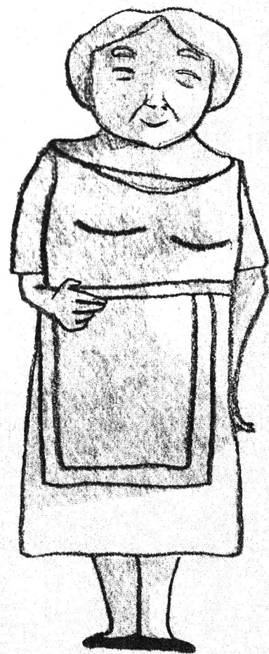
و این هم مامان بزرگم است.