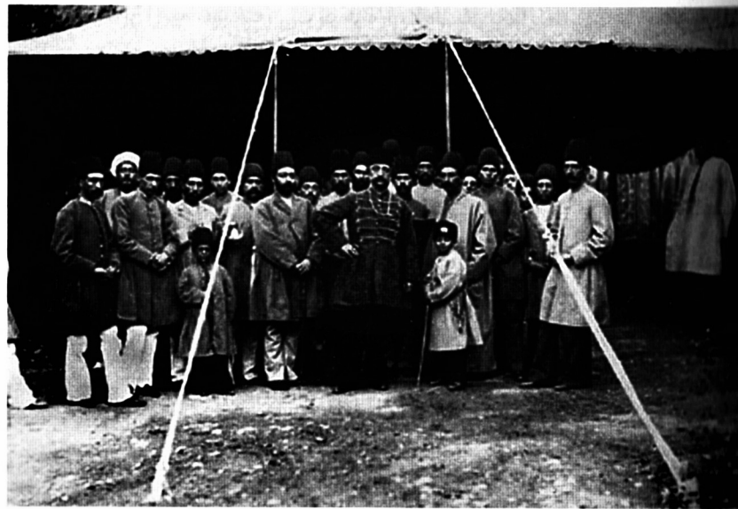
یکی از عکس‌های صنیع‌الدوله از سواد و اطرافش

میرزا ابراهیم در حالی به تهران بازگشت که هنوز در پاریس خبری از برادران لومیر نبود و آن‌ها هنوز سینما را اختراع نکرده بودند که نام‌شان این قدر مشهور شود.