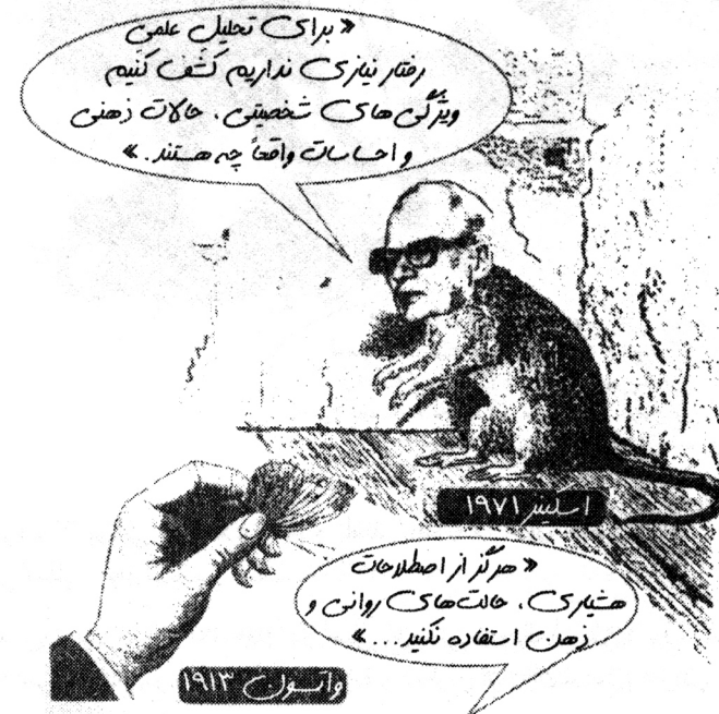
1. B. F. Skinner (1904-1990) 2. J. B. Watson (1878-1958)

دشواری دیگری که در عمل وجود دارد، به قول برخی، ناممکن بودن مطالعه ذهن به طور مستقیم است. در واقع حتی تلاشی برای تعریف ذهن هم کار بسیار دشواری است. برخی روان‌شناسان کاملاً از این کار اجتناب کرده‌اند، به ویژه رفتارگرایانی چون بی. اف. اسکینر ۱ و جی. بی. واتسون ۲ .