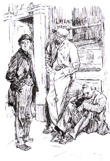
فیل می، تصویرساز انگلیسی، ۱۸۹۵ میلادی