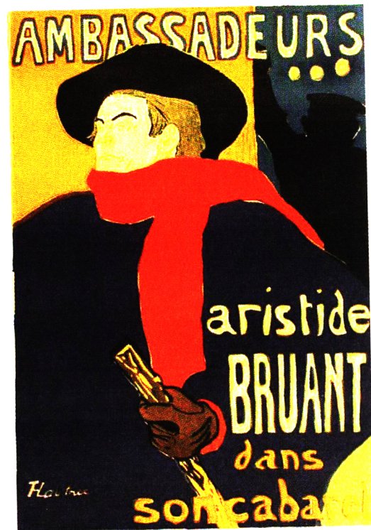
تولوز لوتراک، نقاش فرانسوی، ۱۸۹۵ میلادی