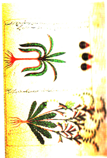
اروپایی متعلق به قرن هشتم میلادی / سوم هجری

medo onocetaur "diaby natura audax phlyer. Cur ps lupioe hie iteoz uq alim filuctris uerore ignitudo et hie gen halente pmutioce pictano dicit autē et abnegae plic dicit ad m h cet nō itellect opat e nūcōs dicit filiū fū ē ill. p. botologu. m. m.