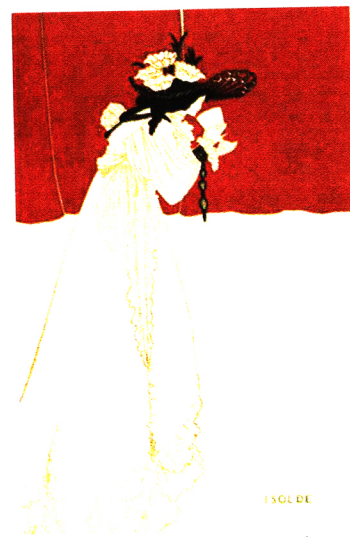
کار: ابرای بیدسلی، تصویرساز انگلیسی، ۱۸۹۰ میلادی