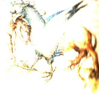
اروپایی متعلق به قرون وسطی

medo onocetaur "diaby natura audax phlyer. Cur ps lupioe hie iteoz uq alim filuctris uerore ignitudo et hie gen halente pmutioce pictano dicit autē et abnegae plic dicit ad m h cet nō itellect opat e nūcōs dicit filiū fū ē ill. p. botologu. m. m.