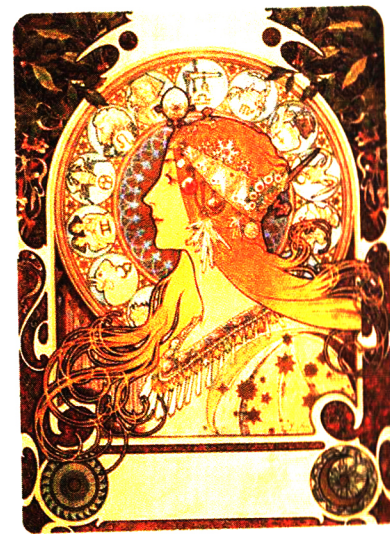
ویلیام مورجا، تصویرساز چک، ۱۸۹۹ میلادی

در قرن پانزده میلادی در اروپا، تصویرسازی با کنده کاری روی چوب باب شد. سپس در قرون شانزده و هفده میلادی، در تکثیر متون و کتاب‌ها، تصویرسازی با کنده کاری روی فلز معمول شد. در اواخر قرن هجده میلادی، با استفاده از کنده کاری روی سنگ (lithography)، تصاویر از کیفیت بیشتری برخوردار شدند. از مهم‌ترین تصویرسازان این دوره می‌توان از ویلیام بلیک نام برد. او در تصاویرش از تکنیک اچینگ برجسته استفاده کرد.