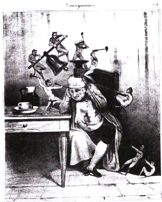
هونوره دمپیر، فرانسوی، ۱۸۶۰ میلادی