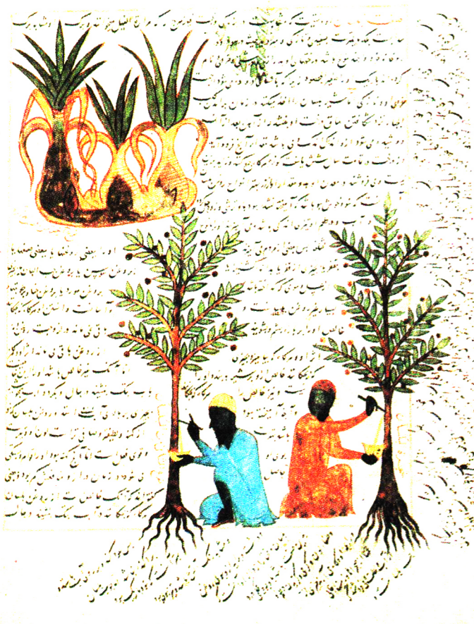
نمونه‌ای دیگر از کتاب‌های گیاه‌شناسی ایرانی از قرن هشتم میلادی / چهارم هجری

نقشه‌ها بوده و کتاب‌هایی که در مورد گیاهان یا حیوانات بوده‌اند. در کتاب‌های طبی قرون وسطی در اروپا که مطالب علمی برای نشان دادن ادوات و شکل‌ها با تصاویر همراه شدند، به تصاویر تذهیب می‌گفتند. هنگامی که گوتنبرگ برای چاپ، حروف جدا از هم، و آنچه بعداً تایپ نامیده شد را ابداع کرد، برای اضافه کردن تصاویر و تزیینات از تصاویری که روی چوب کنده شده بودند استفاده کرد و این آغاز تصویرسازی به معنای امروزی آن برای نشر و چاپ بود.