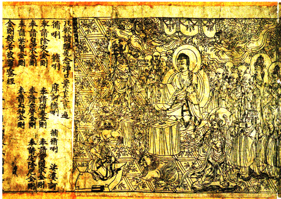
”سوره‌های الماس“ اولین تصویرسازی چاپ شده متعلق به دوران سلسله تانگ در چین که روی چوب کنده کاری شده است. ۸۶۸ میلادی

شروع می‌کنند. اما من آنها را جزئی از کل تاریخ میراث‌های بصری بشر می‌دانم که شاید بتوان اولین نقاشی‌های انسان دانست. تصویرسازی به صورتی که ما آن را می‌شناسیم همراه با متن معنی پیدا کرده و تاریخ واقعی آن از زمان به‌وجود آمدن چاپ، یعنی تکثیر کتاب که با گوتنبرگ متولد شده، شروع می‌شود. گوا اینکه اولین کوشش‌ها در چین انجام شده‌است.