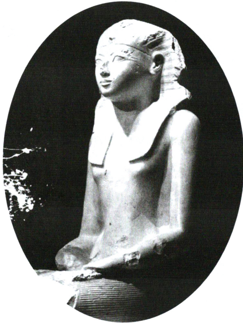
حتشپسوت (حدود ۱۴۵۸- حدود ۱۵۰۷ ق.م)

۱ / نگاه هلیکوپتری: هر چند نمی‌توان گفت که حتشپسوت نخستین رهبر سیاسی زن در تاریخ بوده است اما به درستی به‌عنوان یکی از موفق‌ترین آن‌ها به‌شمار می‌رود. با وجود موانع بی‌شمار، او فرعون ثروتمندترین و قدرتمندترین حکومت دنیای باستان در ۱۴۷۸ سال پیش از میلاد شد. با تصاحب قدرت، او با استفاده از مهارت‌های سیاسی خود، رهبری را برای بیش از ۲۰ سال حفظ کرد. با تولد در خانواده‌ای با اصل و نسب سلطنتی به‌عنوان بزرگ‌ترین دختر توت‌مس اول و ملکه احموس، حتشپسوت با برادر ناتنی کوچک‌تر خود، توت‌مس دوم ازدواج کرد