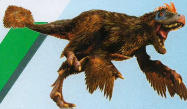
چابک‌دزد دایناسورها در دوره‌ی کرتاسه بسیار متنوع‌تر شدند. این شکارچی کوچک، جلاک و پردار جزو همان گروهی بود که پرنده‌ها از تبار آن پدید آمدند.

تاریخ حیات را سنگواره‌های باقی‌مانده در سنگها ثبت کرده‌اند؛ سنگهایی که زمانی رسوباتی نرم مثل گل بوده‌اند. این سنگهای رسوبی ساختاری لایه‌لایه دارند و سنگهای قدیمی‌تر زیر سنگهای جدیدتر قرار می‌گیرند. هر لایه بازه‌ای از زمان زمین‌شناختی را بازنمایی می‌کند؛ بازه‌ای با نامی مشخص که با مقیاس «میلیون سال پیش» تعریف می‌شود. آنچه این‌جا می‌بینید مقیاس زمانی زمین‌شناختی زمین است که به قسمت‌هایی به نام دوره ۲ تقسیم شده است. هر چند دوره با هم واحدی بزرگ‌تر به نام دوران ۳ می‌سازند.