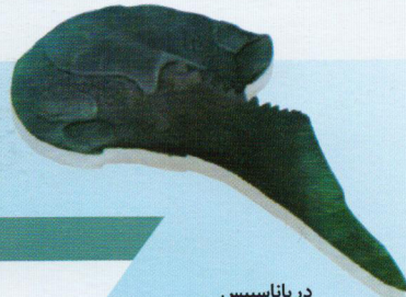
درپاناسپیس این ماهی زره‌دار ۳۵ سانتی‌متر طول و سری پهن و تخت داشت.

دایناسورهای دوران میانه‌زیستی ۱ شگفت‌انگیزترین جانوران تاریخ هستند. آن‌ها محصول فرایند تکاملی بودند که با پیدایش نخستین سوسوی حیات روی زمین در حدود ۳/۸ میلیارد سال پیش آغاز شد. اما بیش از ۳ میلیارد سال طول کشید تا حیات از تک‌یاخته‌های میکروسکوپی فراتر رود. نخستین صورتهای حیات چندیاخته‌ای حدود ۶۰۰ میلیون سال پیش در اقیانوس‌ها پدیدار شدند و زمینه را برای ظهور همه‌ی موجودات زنده‌ای که از آن زمان به بعد پدید آمده‌اند فراهم کردند. اما با پیدایش صورتهای نوین حیات صورتهای کهنه‌تر منقرض می‌شدند. این انقراض‌ها گاهی انقراض‌هایی جمعی و فاجعه‌بار بودند که جهان زنده را دگرگون می‌کردند.