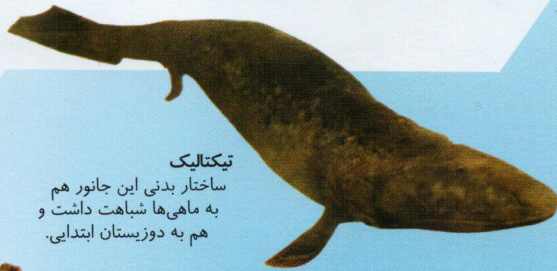
تیکتالیک ساختار بدنی این جانور هم به ماهی‌ها شباهت داشت و هم به دوزیستان ابتدایی.

بسیاری از ماهی‌های جدید پدید آمدند. بعضی از آن‌ها از آب بیرون خزیدند و نخستین دوزیستان شدند.