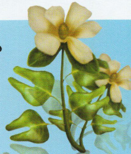
آر کانتوس این نیای کوتاه‌قد درخت لاله یکی از نخستین گیاهان گل‌دار بود. گل‌هایی مگنولیامانند داشت و حدود ۱۰۰ میلیون سال پیش، یعنی اواسط دوره‌ی کرتاسه، زندگی می‌کرد.

کرتاسه ۲ دوره‌ی پیدایش نخستین گیاهان گل‌دار و انواع متعدد دایناسورها بود. این دوره با انقراضی جمعی به پایان رسید؛ انقراضی که همه‌ی دایناسورها و خزندگان بال‌دار ۳ را از صفحه‌ی روزگار پاک کرد و دوران میانه‌زیستی را به پایان رساند.