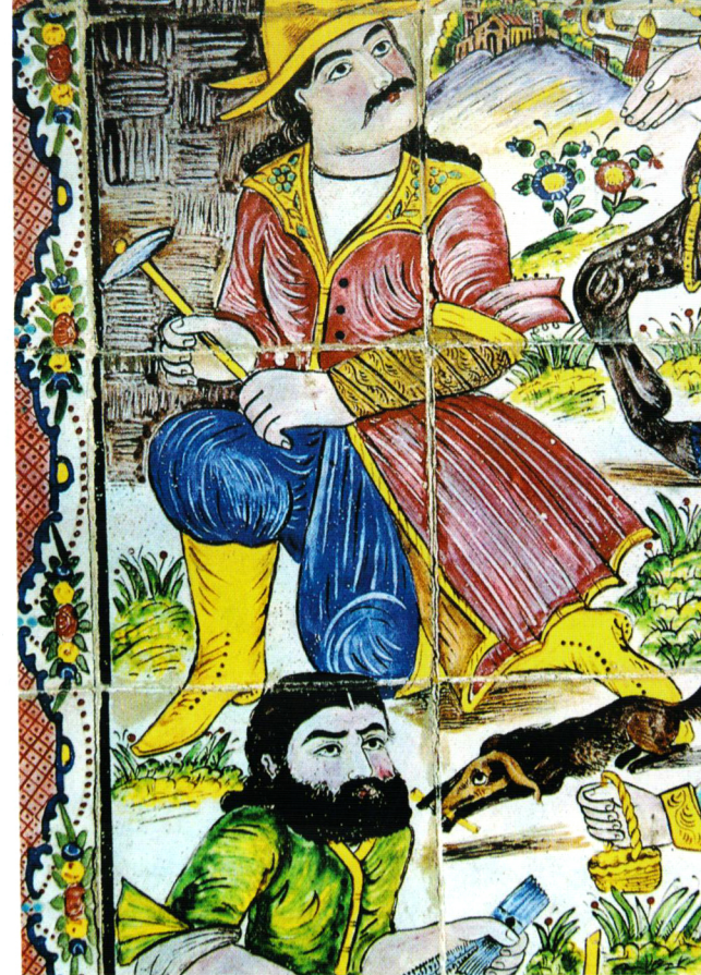
۳ • فرهاد کوهکن قسمتی از یک کاشی تصویری خانه‌ای مسکونی در شیراز اواخر قرن ۱۹م