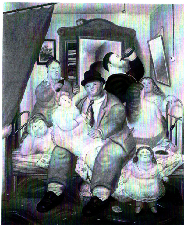
۶- فرناندو بوترو، خانه خواهران آریاس، ۱۹۷۳، رنگ روغن روی بوم، ۲۲۷×۱۸۷، گالری مالپورو، نیویورک.