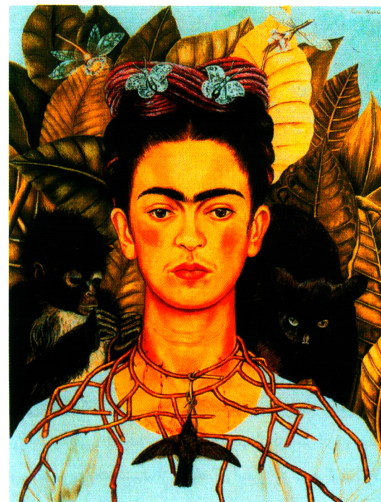
۴- فریدا کالو، پرتره خود نقاش، ۱۹۴۰، رنگ روغن روی بوم، ۶۲×۴۷/۵، مجموعه ایکون گرافی، دانشگاه تگزاس.

آماتور و البته بسیار مستعد مهم ترین نقاش مکزیکی معرفی می‌کند. آنچه که بعدها باعث اشتیاق نقاشی‌های کالو شد، نخست ظهور جنبش فمینیست در ایالات متحده و دوم، انتشار زندگی‌نامه بسیار تابناک هایدن هررا ۱ در سال ۱۹۸۳ بود. این دو عامل دست به دست یکدیگر داده تا طبیعت فوق العاده شخصی و بسیار صریح نقاشی‌های کالو را به کانون توجه همگان سوق دهد. بسیاری از این نقاشی‌ها در واقع پرتره‌های خود نقاش بودند. کالو از قدرت قابل ملاحظه‌ای در خودنمایی برخوردار بود، اما با این حال اگر درمی‌یافت که شهرتش اکنون از شهرت همسرش فراتر رفته است، بطور قطع خود نیز مثل هر کس دیگر شگفت زده می‌شد.