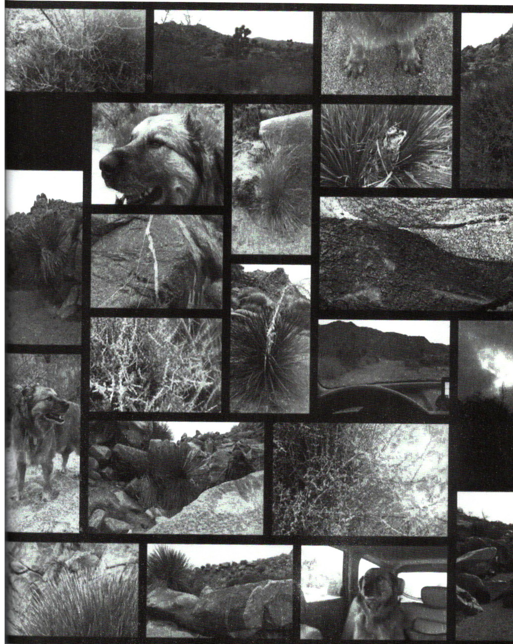
کاربس ام سوابسون

من همسه برای بمرس به طور ءهسی عکاسی می‌کم ماسور وائب