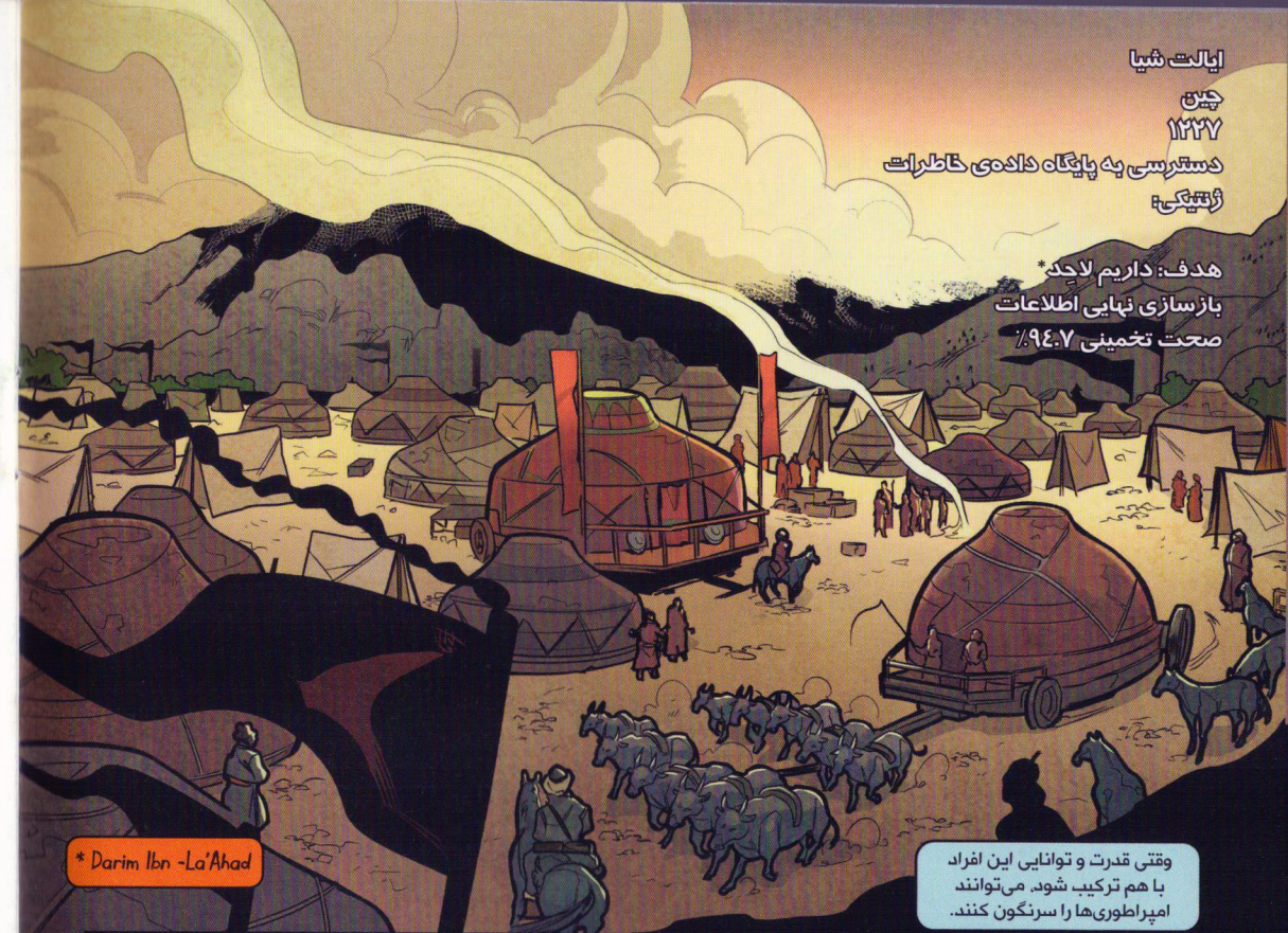
* Darim Ibn-La'Ahad

هدف: داریم لاجد* بازسازی نهایی اطلاعات صحت تخمینی ۹۴.۷٪