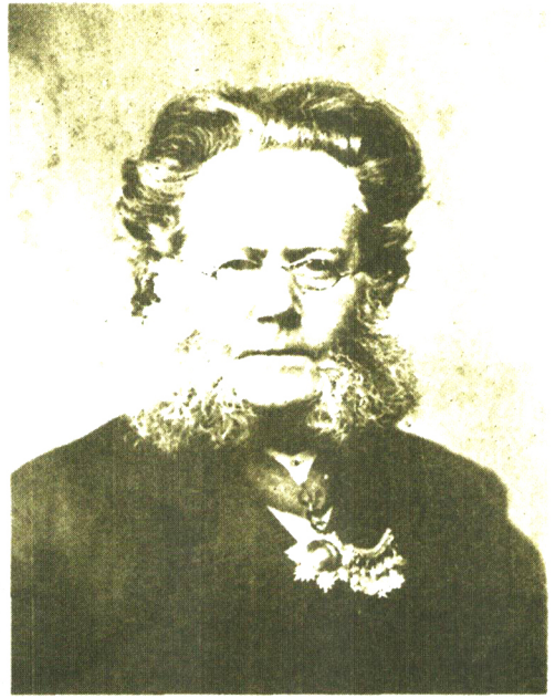
تصویر ۱۰۱۶. (* هنریک یوهان ایبسن درام‌نویس بزرگ نروژی و پایه‌گذار تئاتر واقعگرایی نوین در جهان.

زیرا قهرمان نمایشنامه مردی است که از کنار مسائل خود بی‌اعتنا می‌گذرد. پرگونت، که در آن تخیل و واقعیت بسیار ماهرانه تلفیق شده‌اند، از نظر بسیاری از منتقدان، هجویه‌ای بر شخصیت مردم نروژ است.