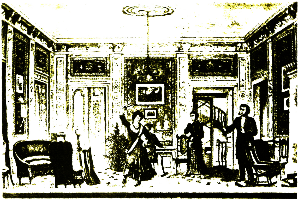
تصویر ۲۰۱۶. (*) صحنه‌یی از نمایشنامه‌ی مرغابی وحشی اثر ایسن، که در ۱۸۸۰ در تئاتر کریستیان در نروژ اجرا شد. طراح این نمایش که برای نخستین بار در نروژ به صحنه رفت آلف یورگنسن بود.

به طور روز افزونی به نمادگرایی ۱۱۷ (سمبولیسم) و مسائلی روی آورد که بیشتر به روابط شخصی می‌پرداختند تا مسائل اجتماعی. اما باید دانست که مایه‌ی اصلی «ده‌ی آثار ایسن یکی است: تلاشی صادقانه و کمال‌اندیش برای افشای تضادهای میان وظیفه‌ی فردی و وظیفه نسبت به دیگران. خانم آلوینگ در نمایشنامه‌ی اشباح بسیار دیر می‌فهمد که زندگی خود را به خاطر ادای وظیفه‌ی افراطی نسبت به دیگران بر باد داده است؛ در حالی که در بسیاری از کارهای اخیر ایسن قهرمان داستان به دنبال توهمهای شخصی خود به خوشبختی‌ی دیگران لطمه می‌زند و سرانجام به خود نیز آسیب می‌رساند.