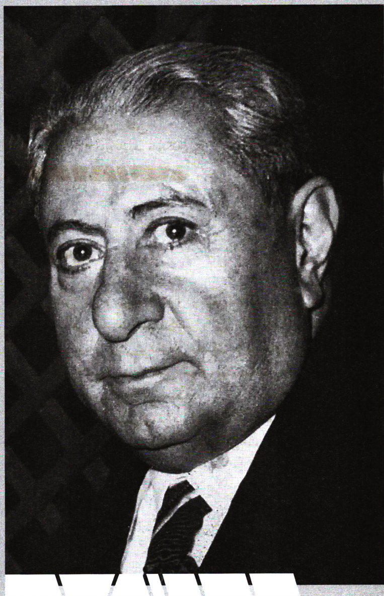
رضا حکمت رئیس مجلس شورای ملی