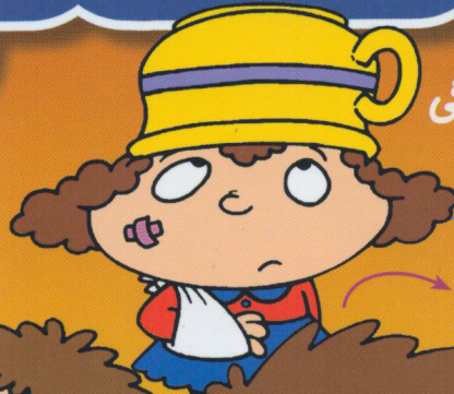
ددی دست و پا چلفتی