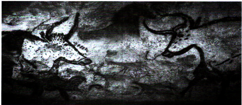
نقاشیهای غار لاسکو فرانسه، حدود ۱۵۰۰۰ تا ۱۰۰۰۰ ق.م