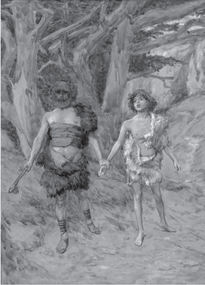
[تابلوی هایبل قایل رابه طرف مرگ می برد، اثر جیمز تیسو نقاش فرانسوی، ح ۱۹۰۰]