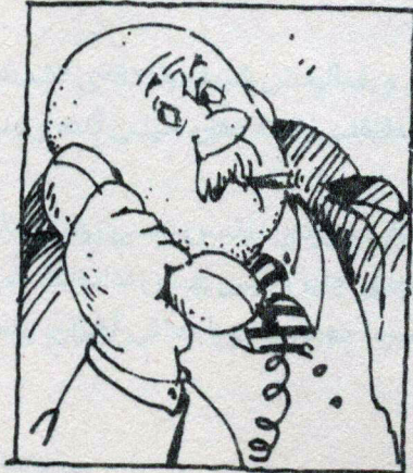
کمیسر ناگل معروف به کمیسر کلیکر (یعنی کله مرمی)؛ چون کله اش از کچلی برق می زند. او در تشخیص فوری خلاف و جرم حس ششم بی نظیری دارد.