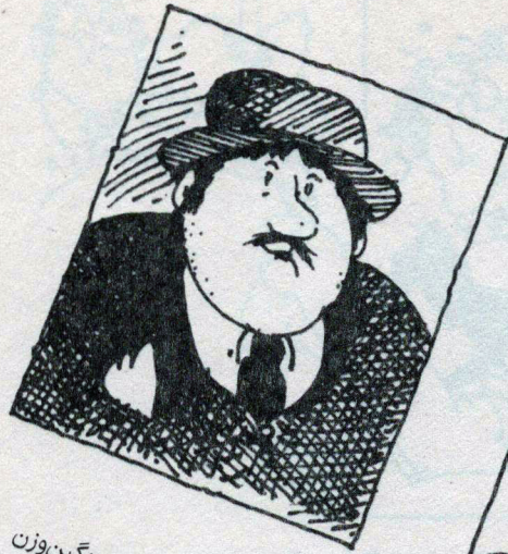
فرد فانه معروف به پلیکی. تک خال سابق مال خرها، عاشق پوشیدن لباس مشکی و کشته و مردهی آشپزی.