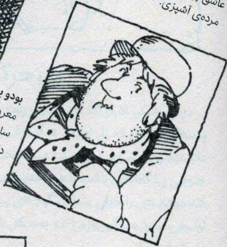
بودو بروکن معروف به بودو دینامیت، بوکسور سنگین وزن سابق، با قدرت خرس و آن قدر نازک دل که حتی دلش نمی آید یک مورچه را بکشد.