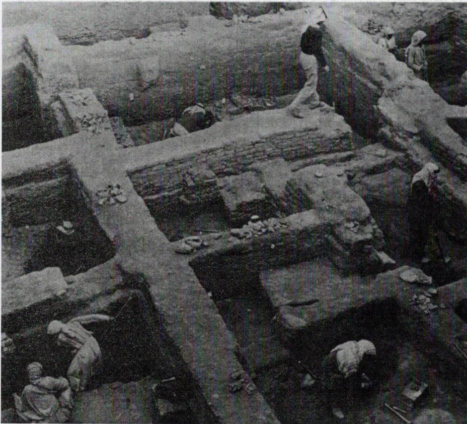
باستان‌شناسان در عراق بر روی تلی کار می‌کنند. آنان با زیر و رو کردن لایه‌های باستانی این تل، خواهند توانست تاریخ سپیده‌دمان تمدن بین‌النهرین را بنویسند.

باستان‌شناسان در گذشته‌ها نقب می‌زدند و همراه تاریخنگاران از دل آثار باستانی نتایجی را بیرون می‌کشند. باستان‌شناسان در کاوش‌های مقدماتی یا گمانه‌زنی، صرفاً به دنبال اشیایی برای نمایش در موزه هستند. حوالی سال ۱۹۰۰ میلادی باستان‌شناسان آلمانی شیوه نظام‌مندی برای کاوش نقاط باستانی موسوم به «تل» را پدید آوردند. تپه‌ای شامل لایه‌های دارای آثار باستانی است؛ مردمان باستان بارها و بارها بناهایی نو را بر روی ویرانه بناهای قدیم‌تر افراشته‌اند، و بدین سان کم‌کم تپه‌هایی پدید آمده‌اند. باستان‌شناسان برای کاوش یک تل مربع‌هایی به وسعت پانزده متر مربع را مشخص می‌کنند که فاصله هر مربع با