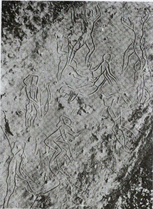
تصویر ۲- رقص جادویی (۲) حدود ۱۵۰۰۰ - ۱۰۰۰۰ ق م. کنده کاری روی سنگ، بلندی میکلا ۲۵ سانتیمتر. غار آدورا، مونت پلگرینو، پارمو

از آن تخمین شده است، که عموماً مشتمل بوده است بر شکل‌های انتزاعی و مخطوط بسیار ساده شده از هیاکل آدمیانی در حال شکار جانوران با کمان و پیکان، یا رقص دسته جمعی مردان و زنان، و یا گله‌های چهار پایانی چون گاو وحشی و بز کوهی و گوزن، البته با محتوایی آرمانی و جادویی که چنین نقوشی در بر می‌داشته‌اند، و بدان اشاره شد. در حدود ۱۲ هزار سال ق م پیشرفت بزرگی به سوی مهارت در بازنمایی تصویر و دقت در مشاهده - یعنی آنچه که در عالم هنرهای تجسمی و افعگری خوانده شده است - برای آن مردمان حاصل شد، که نمونه‌های بارز آن شکل‌های شبیه سازی شده و برجسته نما و رنگین، گاو وحشی و گوزن بر سطح صخره‌های غار آلتامیرا ۳ در شمال اسپانیا، و نیز آثار مکشوف در فون دوگوم ۴ فرانسه است. غیر از این‌ها از دوره پارینه سنگی شمال و پیکره زن در مفهوم رمزی مادر و زاینده، و صنمک‌ها - پاریته النوعهای کوچک اندام - از جمله ونوس ویلندورف ۵ مکشوف در کنار رود دانوب، با قدمت تخمینی ۱۵ هزار سال ق م، و نیز کنده کاری و نقاشی صخره‌ای در مغرب دریای خزر و ناحیه لرستان و غار لاسکو ۶ در فرانسه [وجه بسیار نقاط دیگر] بر جا مانده است، با این ویژگی که مشاهده می‌شود در پاره‌ای موارد نقش جانوری یا انسانی بر روی نقش زیرین به دفعات اجرا شده است. (تصاویر ۱، ۲، ۳) در پایان ذکر این نکته لازم است که اگر دوره پارینه سنگی در ناحیه‌ای چون بین‌النهرین حدود کمتر از ۸ هزار سال ق م به پایان رسید، در میان اقوام بدوی یا به دور مانده از کاروان تمدن، چون اسکیموها یا بومیان استرالیا، دوره پارینه سنگی تقریباً با همان خصوصیات ابزار و معیشت خود تا زمان متأخری چون قرن نوزدهم میلادی استمرار یافته و بر جا ماند.