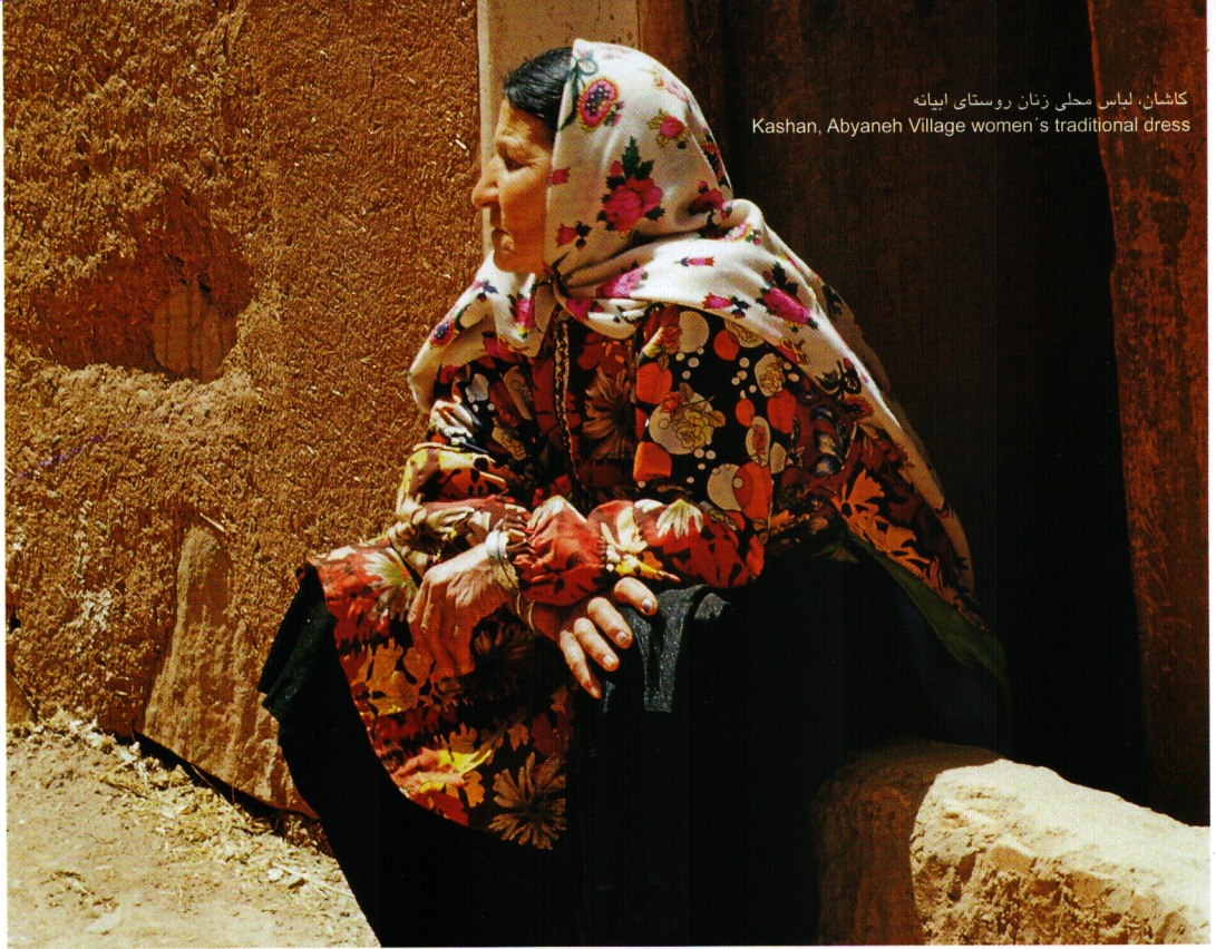
کاشان، لباس محلی زنان روستای ابیانه Kashan, Abyaneh Village women's traditional dress

Abyaneh Village: is an ancient village near Kashan, remarkable for the red earth that gives its buildings their fiery tones. Here every roof is your neighbor's front yard, giving inhabitants a peculiar combination of privacy and intimacy. The town's unique architecture and its inhabitants' traditional costumes and earthen pottery are all traditions going back over two thousand years.