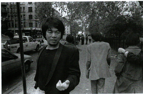
آی وی وی در ایست ویلیج نیویورک، ۱۹۸۵

اولین بار در نیمه دوم دهه ۱۹۹۰ آثار آی وی وی را دیدم. به همراه هو هانرو ۱ نمایشگاه «شهرهای متحرک» ۲ را آماده می‌کردیم و در پکن مهمان اولی سیگ سفیر وقت سوئیس بودیم. اولی سیگ ۳ حامی بزرگ و مجموعه‌دار هنر معاصر است. سفارت پر بود از آثار هنری چین. بعد از آن آی وی وی را بارها دیدم و در طول ده سال مصاحبه‌های زیادی با او کردم. آی وی وی مدام مفهوم هنر را گسترش می‌دهد: او هنرمند، شاعر، معمار، کیوریتور، متخصص صنایع دستی عتیقه چین، ناشر، شهرساز، مجموعه‌دار، وبلاگ‌نویس و غیره و غیره است. واقعیات موازی در آثارش بسیار پیچیده است و همین است که او را بی‌همتا می‌کند.